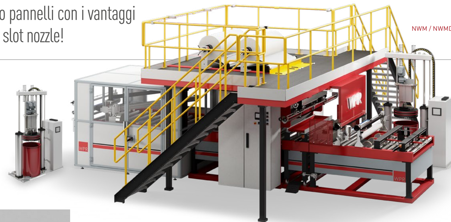
PANNELLI RIVESTITI CON NWM / NWMD

NWM/NWMD è il sistema singolo o doppio, ideale per il rivestimento di pannelli in legno, MDF o truciolare fino a 2200mm di larghezza. Offre tutti i vantaggi dell'applicazione mediante slot nozzle ottimizzando le performances dell'incollaggio con adesivi hot melt e HMPUR: