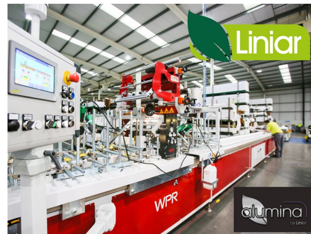
NWS.350.12000 - STABILIMENTO LINIAR

CONTATTACI PER SCOPRIRE COME INTEGRARE NWS.350.12000 NELLA TUA LINEA DI PRODUZIONE: WWW.WPR.IT